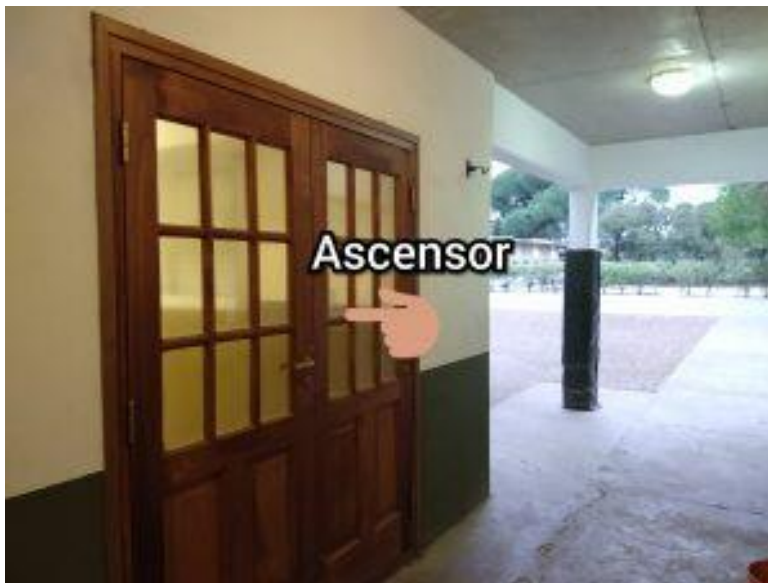
Beoogde locatie lift